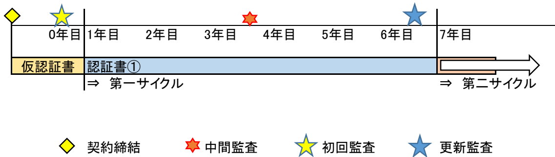
図 5.2 認証サイクル（6年）と監査実施時期